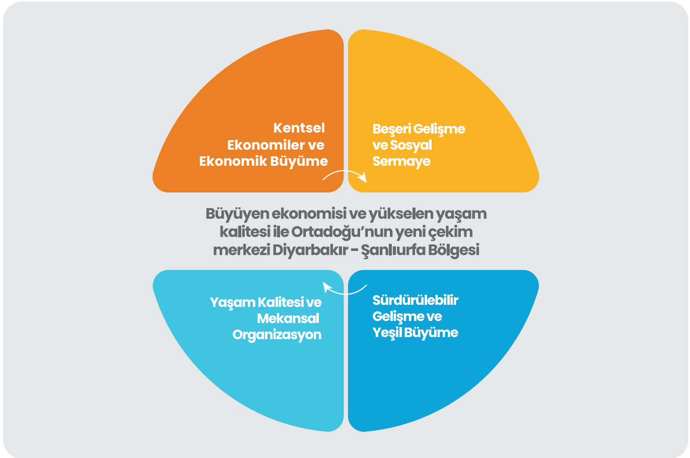
Tablo 2: TRC2 2014- 2023 Bölge Planı: Bölge Vizyonu

TRC2 Bölgesi 2014-2023 Bölge Planı; hazırlanan mevcut durum raporu, yapılan analizler, katılımcı süreçlerle Bölge aktörlerinden elde edilen sorun önceliklendirme, çözüm önerileri ve yerel olanaklara dair bildirimlere göre ulusal politika ve önceliklere uygun olarak hazırlanmış olup bölgesel gelişmeyi sağlayacak birbirini tamamlayıcı nitelikte dört gelişme ekseninden oluşmaktadır.