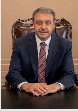
Hasan ŞILDAK Yönetim Kurulu Başkanı Şanlıurfa Valisi