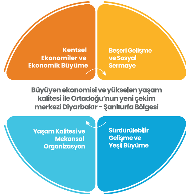
Tablo 2: TRC2 2014- 2023 Bölge Planı: Bölge Vizyonu

TRC2 Bölgesi 2014-2023 Bölge Planı; hazırlanan mevcut durum raporu, yapılan analizler, katılımcı süreçlerle Bölge aktörlerinden elde edilen sorun önceliklendirme, çözüm önerileri ve yerel olanaklara dair bildirimlere göre ulusal politika ve önceliklere uygun olarak hazırlanmış olup bölgesel gelişmeyi sağlayacak birbirini tamamlayıcı nitelikte dört gelişme ekseninden oluşmaktadır.